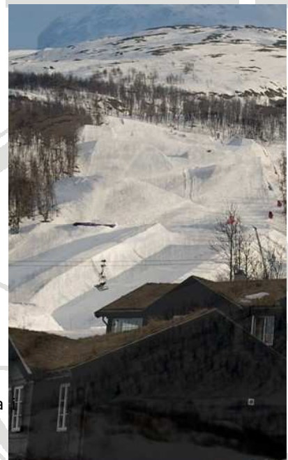
Ciò che si può vedere dallo chalet

PER PRENOTAZIONI: info@hoticesnowboard.it +39 338 99 87 382