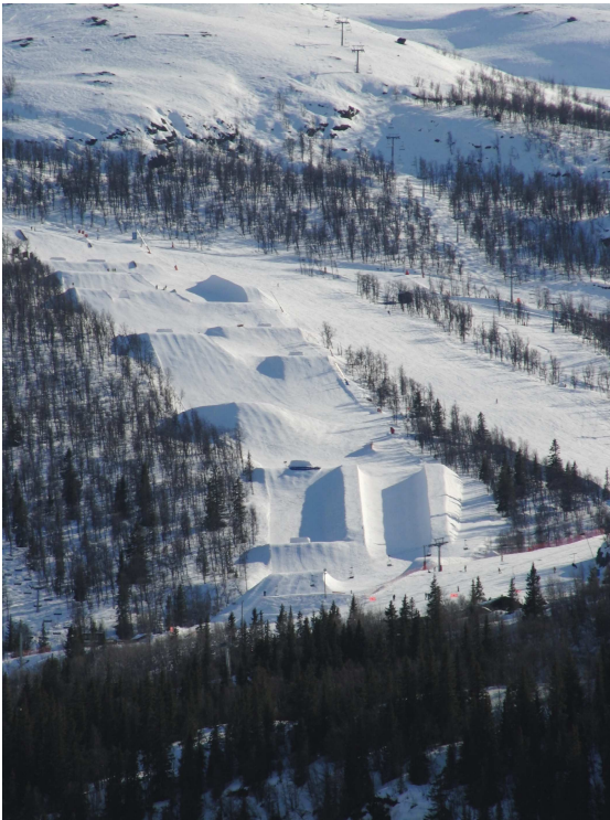
Una parte dello snowpark di Hemsedal - Norvegia

Lo snowboard per noi è molto più di uno sport ... è amicizia, è viaggiare, è fare esperienze nuove, è conoscere posti nuovi, è conoscere gente nuova, quindi accrescere il proprio bagaglio culturale ... anche lo snowboard può darti la possibilità di crescere e di imparare non solo nuove manovre, ma anche tante altro.